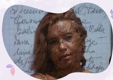
Cinefòrum 25N: Sessió de curtmetratges

Reserva d'entrades al mail info@ccparcsandaru.cat . Fins divendres 15 de novembre.