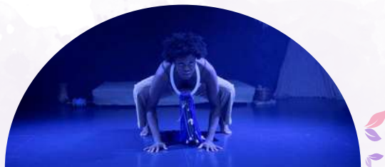
Títuba, bruixa, negra i ramera

Reserva prèvia en el següent sistema de reserva