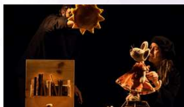
La rateta Martina i el ratolí Serafí

Cal inscriure's al casal de referència, com a màxim, el 22 de novembre.